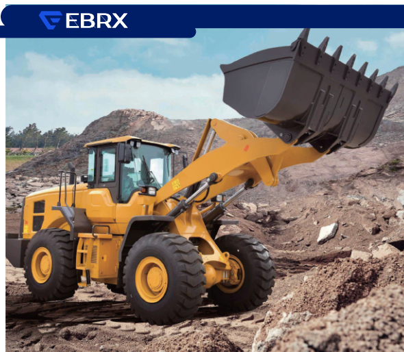
PÁ EX-P50 Carregadeira

Cabine fechada ROPs/FOPs com ar condicionado sobre chassis traseiro com visão ampla, sistema completo de iluminação, de retrovisores e avisos sonoros. Faróis auxiliares dianteiros e traseiros montados na cabine. Assento com suspensão. Chassis articulado a 40° para ambos os lados. Opcionais: Caçamba lisa, Caçamba 2,5m 3 e Pneus 25.5-25.